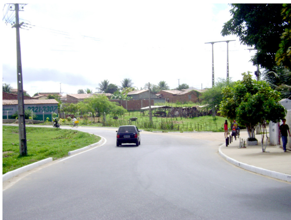
Imagem 08: Interface zona urbano/rural